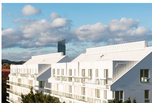
fol. ujęcie budynków o numerach administracyjnych nr 77F i nr 77 od strony ul. Wita Stwosza, z widokiem w kierunku dzielnicy Oliwa

Data wydania decyzji o pozwoleniu na użytkowanie: marzec 2026