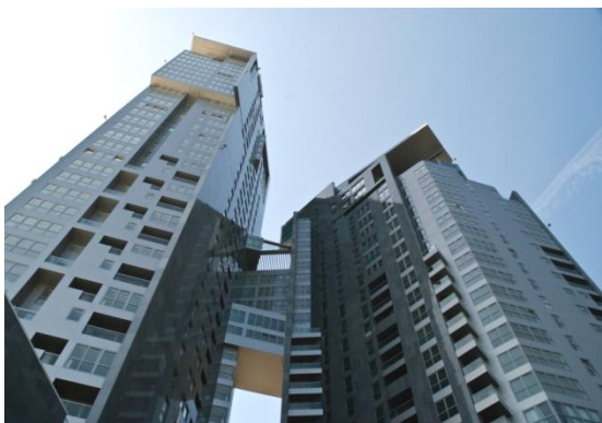
fot. widok ze Skweru Kościuszki