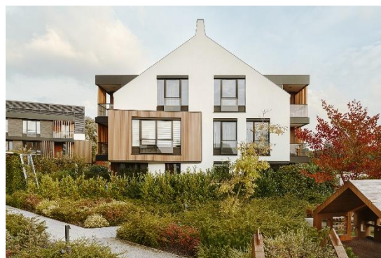
fot. widok na budynek I etapu od strony placu zabaw