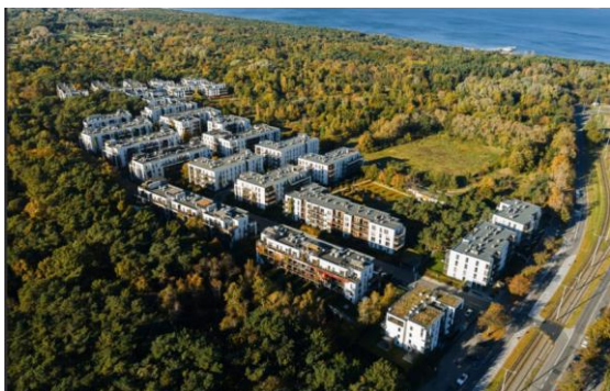
fol. widok na osiedle z lotu ptaka