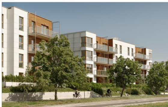
fol. widok od strony Alei. Gen Józefa Hallera nr 234,236