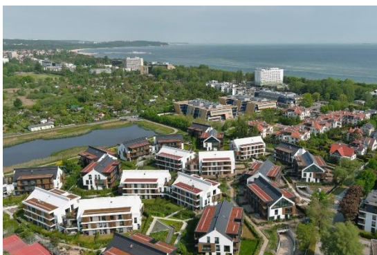
fot. widok z lotu ptaka

Data wydania decyzji o pozwoleniu na użytkowanie (na podstawie art. 31 1 ustawy z dnia 2 marca 2020 r. o szczególnych rozwiązaniach związanych z zapobieganiem, przeciwdziałaniem i zwalczaniem COVID-19, innych chorób zakaźnych oraz wywołanych nimi sytuacji kryzysowych – wydano zaświadczenie o braku podstaw do wniesienia sprzeciwu, uprawniające do rozpoczęcia użytkowania budynków ostatniego etapu): czerwiec 2023